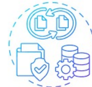
Gobernanza de Datos