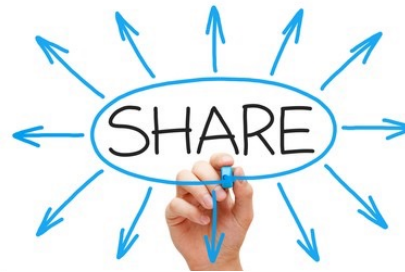
Analítica avanzada gracias a compartir diferentes fuentes de Datos