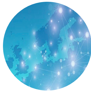
Espacio de Datos